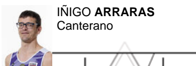
IÑIGO ARRARAS Canterano