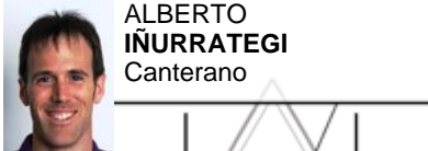
ALBERTO IÑURRATEGI Canterano