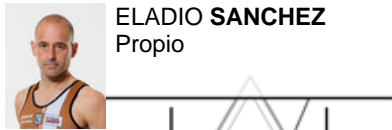
ELADIO SANCHEZ Propio